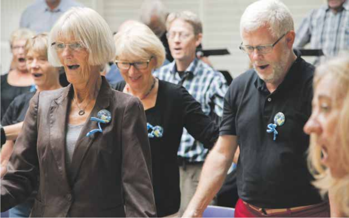
PUBLIKUMSKORET Den Jyske Opera Vinterhalvåret 2015/2016