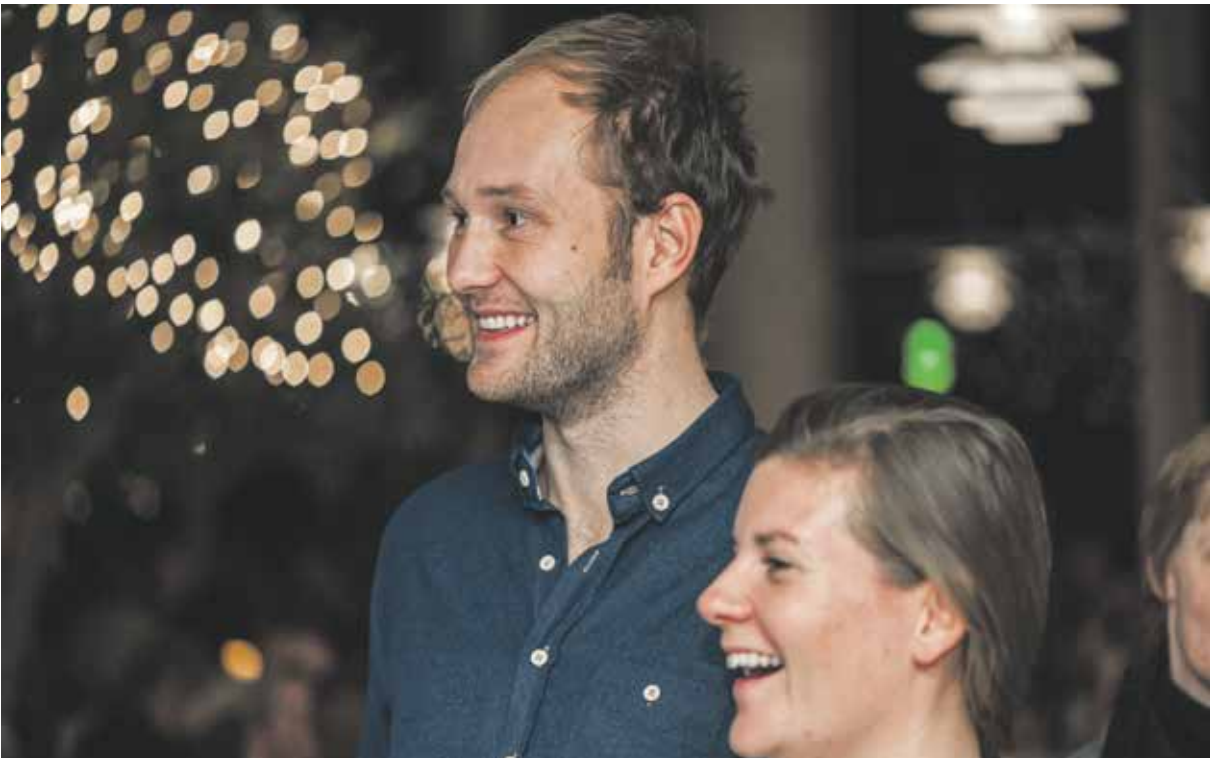
OPERAJOMFRU Introduktioner